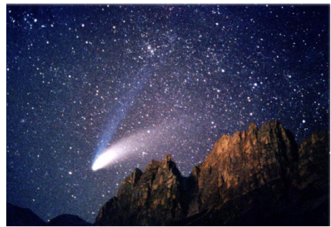
Figure 1 : Comète de Hale-Bopp

Les divers peuples du monde connaissent les comètes depuis bien longtemps. Les comètes apparaissent dans le ciel, leur brillance augmentant progressivement en quelques mois en révélant une majestueuse structure formée d'une tête brillante, appelée chevelure ou coma, suivie d'une longue traîne lumineuse (figure 1). Les comètes s'affaiblissent ensuite progressivement et disparaissent en plusieurs mois.