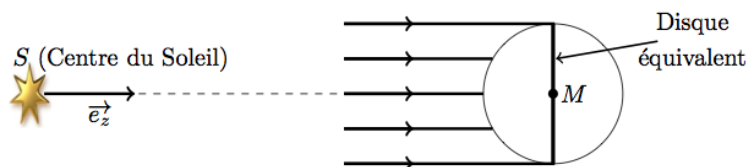
Figure 3 : pression de radiation

La queue courbée de la comète est constituée par de petites particules, supposées parfaitement réfléchissantes, assimilées à des sphères homogènes de rayon b et de masse volumique \mu . Une particule sphérique située dans l'espace interstellaire (assimilé au vide) à la distance r du Soleil reçoit de la part de cette étoile une énergie. Afin de simplifier les calculs, on modélise la particule par son disque équivalent de rayon b , supposé conducteur parfait (Figure 3).